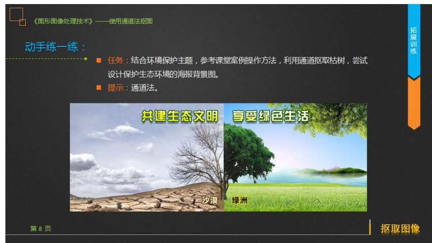
图 4 学生完成课堂作业