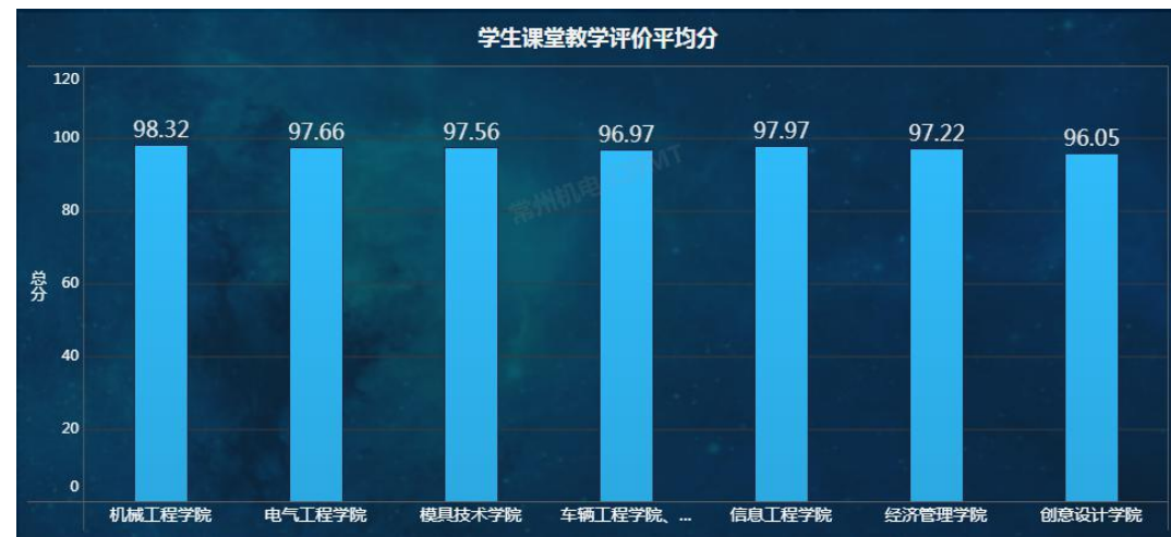
图 6 各二级学院学生课堂教学评价平均分